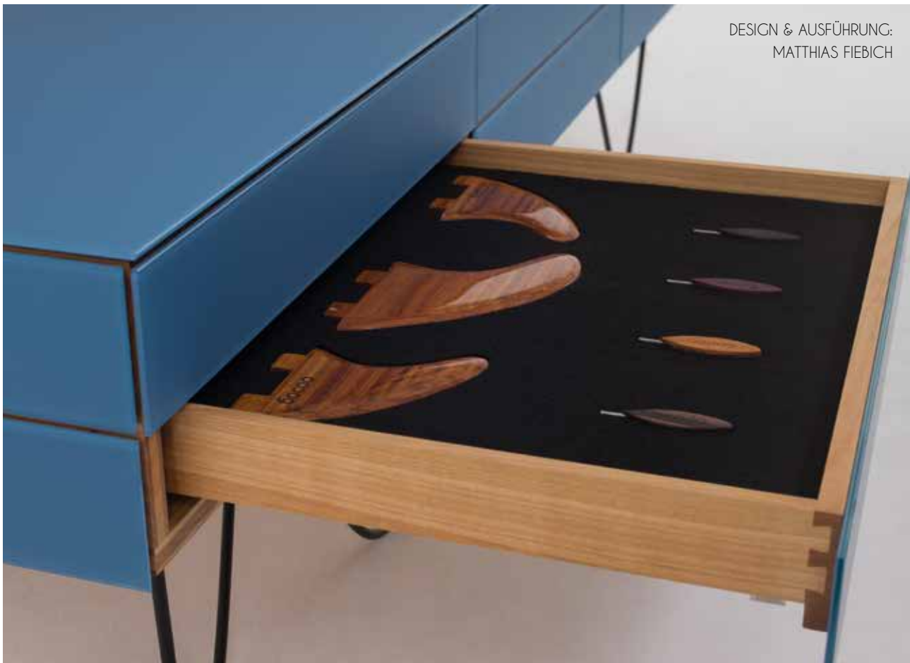
DESIGN & AUSFÜHRUNG: MATTHIAS FIEBICH

entschieden, dass ich eine Lehre machen und keine Schule mehr besuchen möchte. Das Handwerkliche, das Holz, das hat mich – vielleicht vom Wald übergehend – besonders angesprochen.